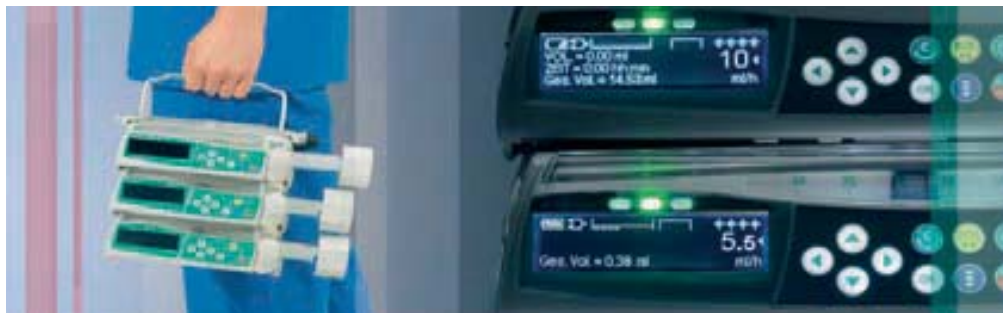
Muy ligera de peso y seguimiento luminoso del estatus de funcionamiento