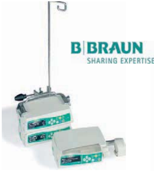
Soportes para instalación en batería