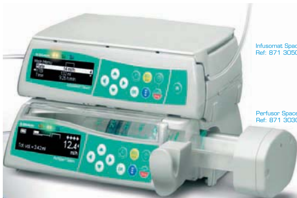
Infusomat Space Ref: 871 3050