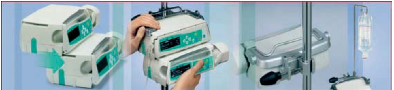
Fácil de montar, sistema de seguridad y todo tipo de accesorios para su instalación