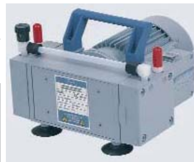
MZ-2C Ref. 1980500

Bomba de membrana versión química, sin lubricación. Los materiales en contacto con el producto son químicamente inertes. Compacta, silenciosa y de larga duración. La amortización se consigue de forma rápida si se utiliza en lugar de la bomba de chorro de agua. Accesorios: Válvula solenoide VC1.3 y control de bomba VC2.4.