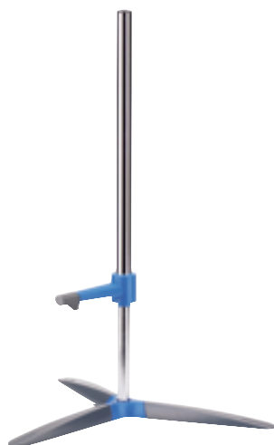
RV05.3 Ref. 3154100