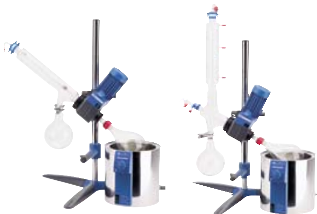
RV05 Basic 1-B Ref. 8017900

Se elimina el "efecto chimenea", responsable de los choques y de la formación de espuma. Juntas tipo Rodaviss para aflojar de forma sencilla las uniones esmeriladas pegadas. Accesorios: equipo de vidrio RVO6.2, controlador de vacío VC2.