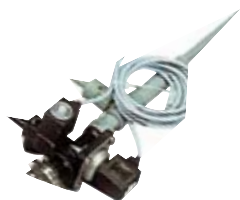
VC1.1 Ref. 1980700

Bomba con válvulas para el chorro de agua y chorro de refrigeración. Corte automático del agua de refrigeración tras finalizar la destilación. Sólo puede utilizarse en combinación con el controlador de vacío VC.2. Consumo reducido de agua.