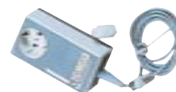
VC2.4 Ref. 2439100

Control de bomba para utilizar junto con la bomba MZ-2C, o cualquier otra de vacío electrónica en combinación con el controlador VC2. Ventajas frente al VC1.3: reduce las molestias ocasionadas por los ruidos y ahorra energía eléctrica. La alimentación de corriente de la bomba se interrumpe y se abre.