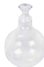
RV06.7 Ref. 190600

Matraces de evaporación. Material: vidrio borosilicato.