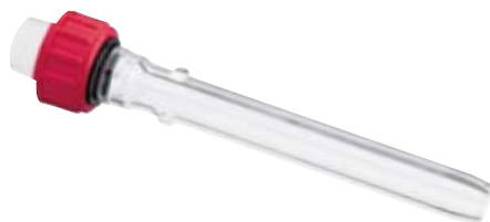
RV06.11 Ref. 1958000

Soporte telescópico que puede subirse y bajarse sin problemas gracias a un resorte de gas que funciona sin tiros. Diám. de la barra del soporte: 34 mm. Carga máxima: 10 Kg. Carrera: 190 mm. Altura: 710-900 mm. Dimensiones (AxFxH): 580x450x900 mm.