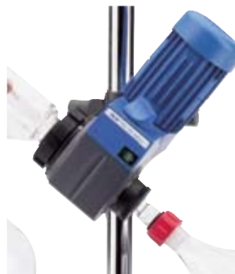
RV05 Basic Ref. 3075000

Accesorios: soporte telescópico RVO5.3, equipos de vidrio RVO6.1 y RVO6.2, baño calefactor HB4 y pinza de fijación R271 (Ver pág. 236).