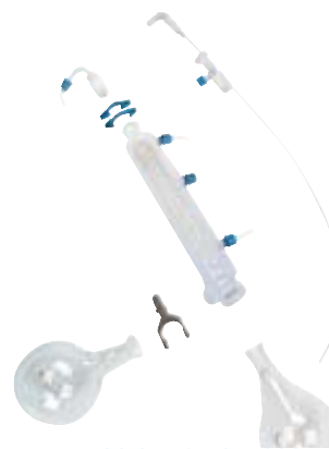
RV06.2 Ref. 1957600

Equipo de vidrio, en vertical para economizar espacio. La pieza de distribución está equipada con una llave de condensado y un canal de descarga, que evitan que el condensado entre en contacto con la junta. El tubo de PTFE permite alimentar continuamente el disolvente destilado. Incluye matraces de 1 litro para evaporación y recepción.