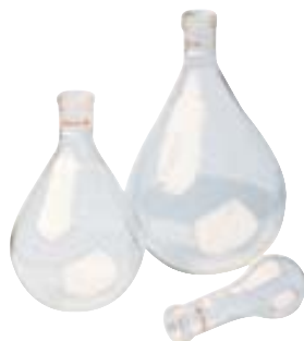
RV06.4 Ref. 1905600 br&gt; RV06.5 Ref. 1905500