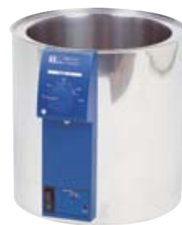
HB4 Basic Ref. 2520000

Baño calefactor cilíndrico con elementos calefactores en el fondo del baño. Posibilidad de utilizar aceite de baja viscosidad (50 mPas) o agua como soporte térmico. Con limitador de temperatura según DIN 12876, regulable sin interrupciones. Protección frente a quemaduras con revestimiento doble y asas de transporte.