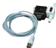
VC1.3 Ref. 2163500

Bomba con válvulas para el chorro de agua y chorro de refrigeración. Corte automático del agua de refrigeración tras finalizar la destilación. Sólo puede utilizarse en combinación con el controlador de vacío VC.2. Consumo reducido de agua.