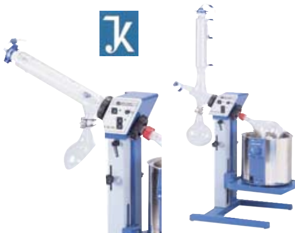
RV06-ML 1-B Ref. 8010000

Se elimina el "efecto chimenea", responsable de los choques y de la formación de espuma. Juntas tipo Rodaviss para aflojar de forma sencilla las uniones esmeriladas pegadas. Accesorios: equipo de vidrio RVO6.2, controlador de vacío VC2.