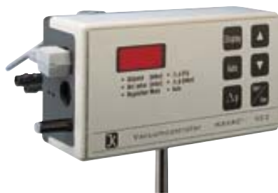
VC2 Ikavac® Ref. 2300000